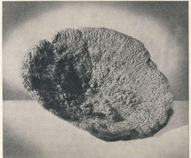
Zimocca: för industrin